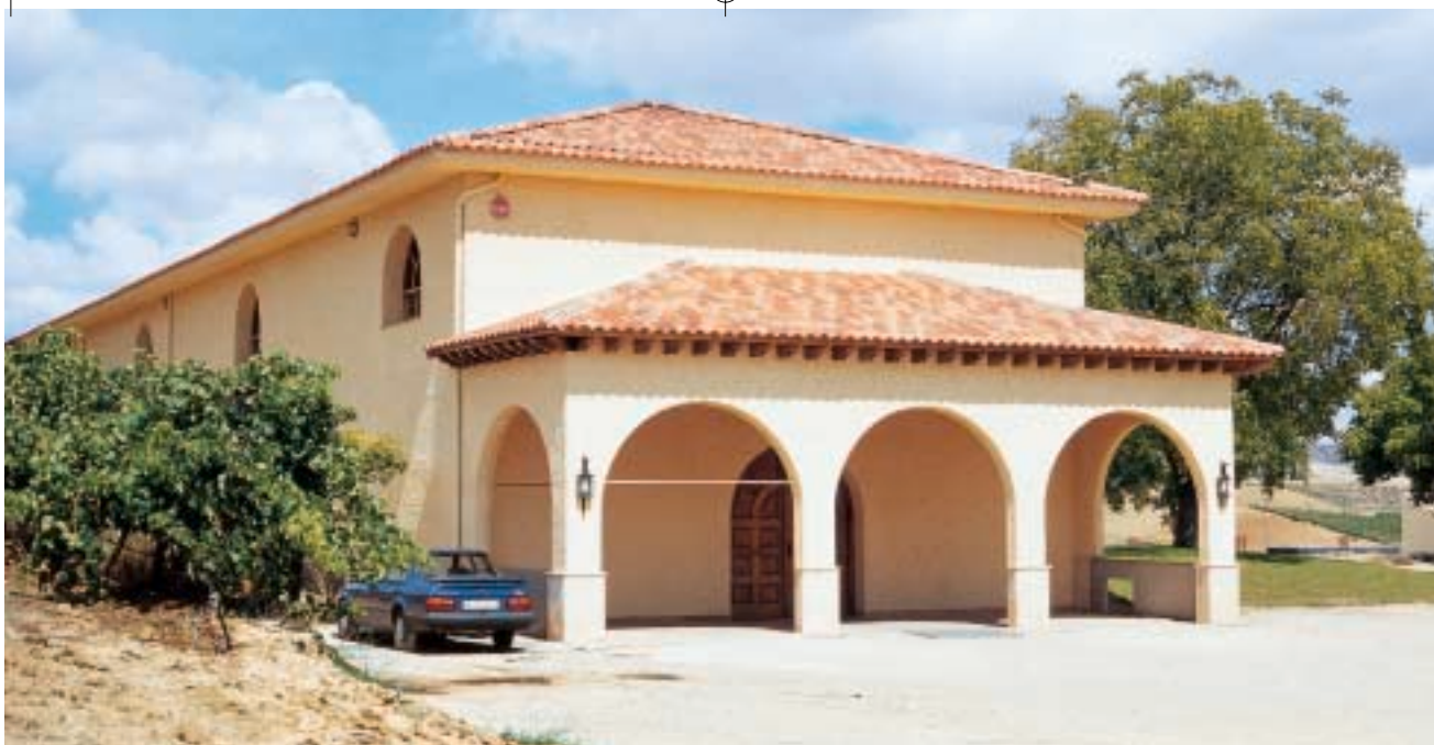
Le domaine de Paco Rodero compte aujourd'hui 25 hectares de vignes en propriété.

actuellement une des plus belles bouteilles espagnoles du moment. Les récents millésimes, pour ne parler que de ceux-ci, sont portés au pinacle lors de concours mondiaux, par l'éminence de la sommellerie et les critiques les plus pertinents.